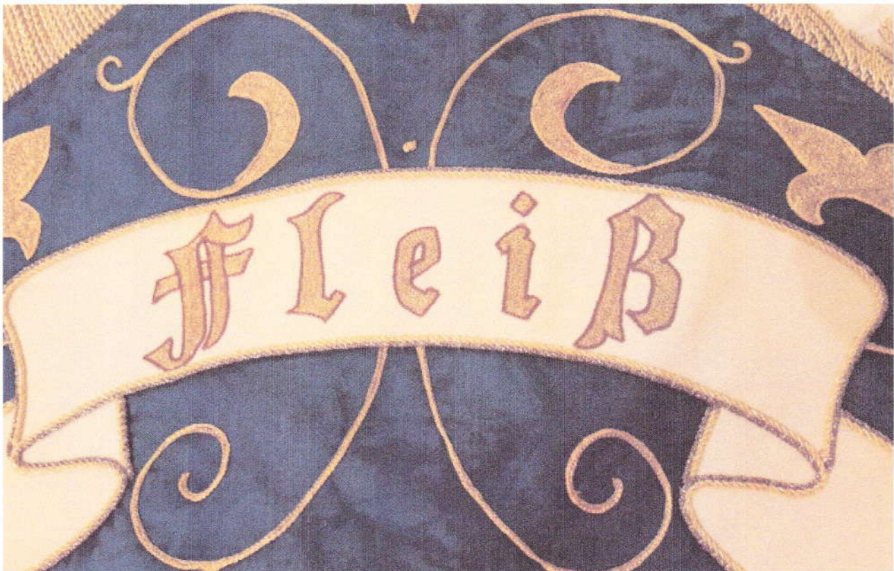
Die Perle in Verbindung mit Fleiß

Die vier Perlen, zwischen den Lilien und den Schriftbändern, in ihrer jeweiligen Verbindung mit einem der vier Schriftbänder auf der Fahne symbolisieren die Gründungswerte des Truderinger Burschenverein von 1895.