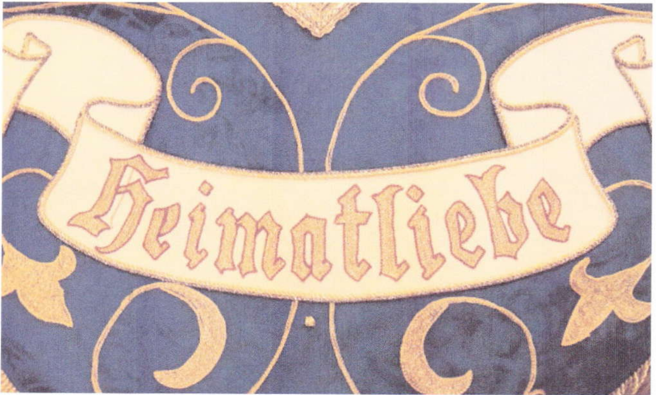
Die Perle in Verbindung mit Heimatliebe