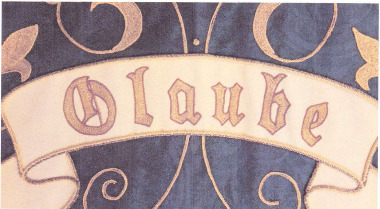
Die Perle in Verbindung mit Glaube